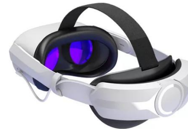
STRAP CON BATERIA