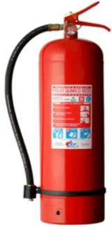
EXTINTOR POR MODELO