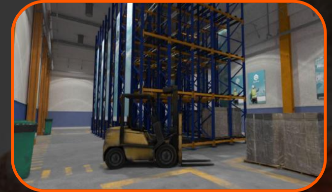
BODEGAS DE ALMACENAJE