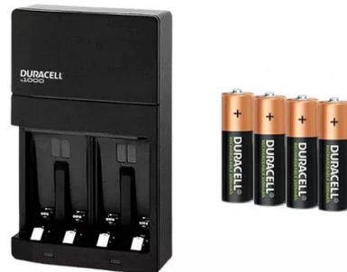
CARGADOR DE PILAS