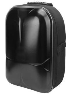
BOLSO POR MODELO